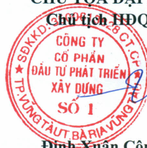
Đinh Xuân Công